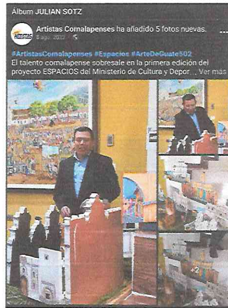
Publicación de la página Artistas Comalapenses realizada en el marco de la inauguración de la exposición Espacios.