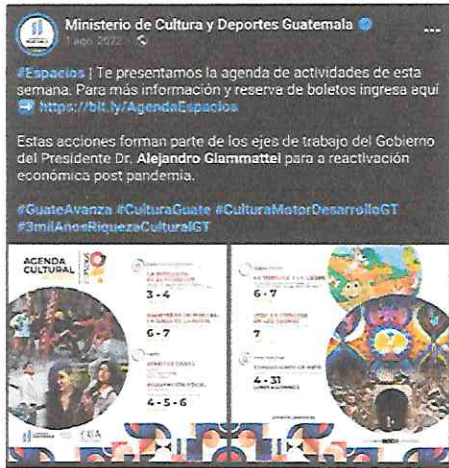
Publicación del Ministerio de Cultura y Deportes en su página oficial de Facebook realizando la invitación al público en general.